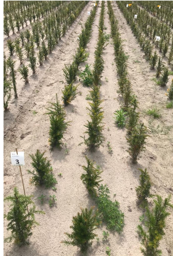
2,7 l/ha Devrinol