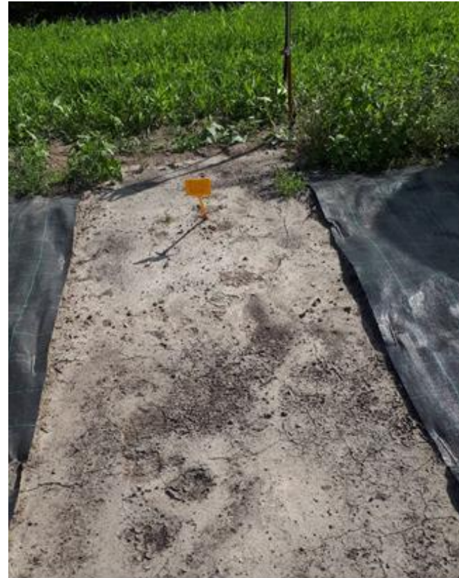
Devrinol 2,7 l/ha 4 weken na toepassing Omstandigheden: Nat