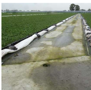
Potten op niet doorlatende ondergrond