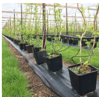
Potten doorlatende ondergrond

Teelten los van de ondergrond / bodem op natuurlijk of kunstmatig medium