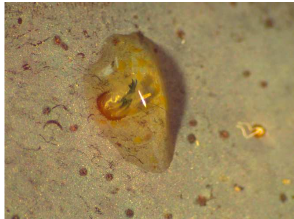
In de schil zitten kleine gaatjes, vaak met een druppel vocht. Larven zitten net onder de schil en komen regelmatig naar buiten om adem te halen.