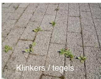
Klinkers / tegels