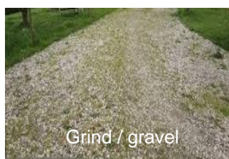
Grind / gravel