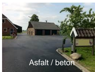
Asfalt / beton